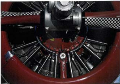
Trotz der starken Beanspruchung im Renneinsatz und des schon hohen Alters einzelner T-6 befinden sich die Flugzeuge in einem Top-Zustand – mitunter sogar weitaus besser als bei der mehrere Jahrzehnte zurückliegenden Erstausslieferung.